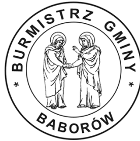
PIECZĘĆ BURMISTRZA GMINY BABORÓW (średnica 36 mm)